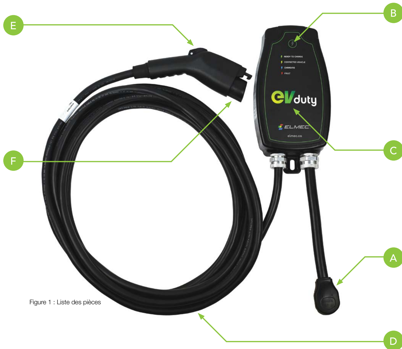
Figure 1 : Liste des pièces

Voici une description des pièces principales de cet équipement :